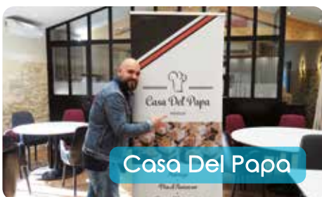
Casa Del Papa

Coiffure / Esthétique / Épilations au fil 19, avenue Henri Becquerel Tél. 09 50 44 14 58 / 06 78 59 46 89 Facebook / Instagram : @ayse coiffeuse maquilleuse