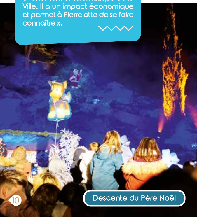
Descente du Père Noël