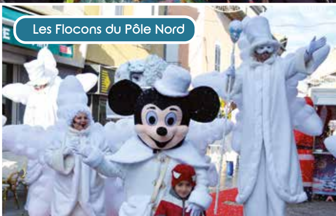
Les Flocons du Pôle Nord