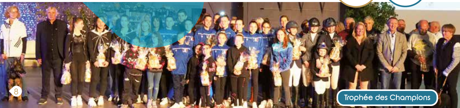
Trophée des Champions